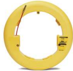
Wee Buddy® sin el kit de accesorios

La cinta buscadora Wee Buddy® de fibra de vidrio es un producto de alta visibilidad, que no es conductor eléctrico, con una funda protectora de polímero [diámetro externo de 3.175 mm (1/8")]. Esta unidad liviana y compacta es ideal para buscar todo tipo de conductos.