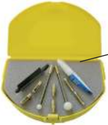
Wee Buddy® con el kit de accesorios