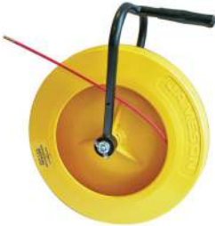
Modelo de bobina portátil