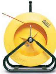
Modelo de soporte